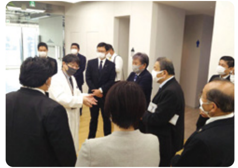
国立がん研究センター内の先端医療研究センターを視察。県下医療機関の技術向上に繋がります！