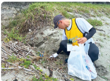
塩成海岸で開催された県主催「愛媛のスポGOMI伊方ステージ」に参加。海洋ごみ削減の必要性を痛感しました！