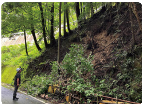
土砂崩れが起こった八幡浜市内の県道にて。県に迅速な復旧を要請いたしました！