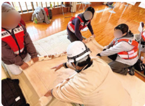
しらはま防災フェスタに参加。簡易担架を作り、乗ってみました。いざという時の備えに努めます！

故郷・八西地域の課題解決、地域住民の幸福のために引き続き精一杯働かせていただきます！