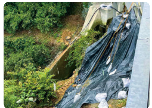
大雨で破損した南予用水の灌水及び防除施設（三崎）。すぐに対応いただいた県と地元企業に感謝！