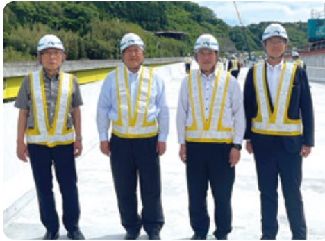
松山自動車道の四車線化工事区間を視察。利便性と「命の道」の更なる機能性向上を推進します！