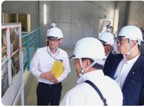
西日本豪雨で全壊し、更新工事を終えた肱川発電所にて。災害に強いインフラ整備に尽力します！