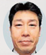
菅規行次期副知事