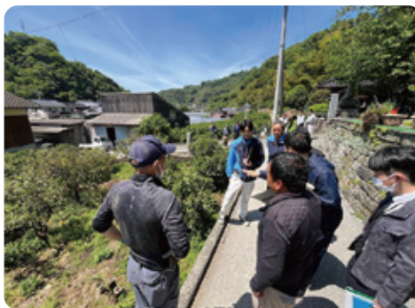
日土町にて防火水槽設置のお手伝い。地域と行政を繋ぐ努力を怠りません！