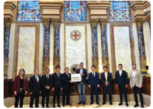
県議会海外派遣でスペインを訪問。「美食の町」サンセバスチャンのゴイア市長に県産魚類をPR！