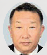
高岡哲也次期教育長