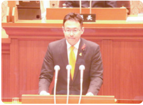
2月議会で初めての一般質問に登壇しました。とても全ては聞き足りず、次回も頑張ります！

公務を通じての議論や同僚議員らとの日々の政務を通じて愛媛県や故郷・八西地域の更なる発展を模索します！