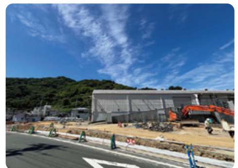
県果樹農業振興計画の掲げる広域選果体制のもと建設が進むJAにしうわ新みつる共選。事業の進捗を後押しします！